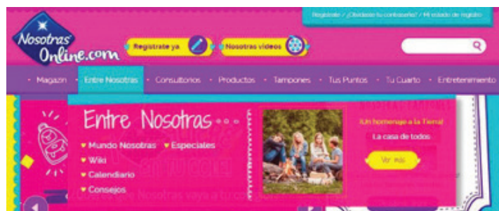
Fig. 1: índice de “Nosotras”

binario –dos únicos géneros posibles que representan al varón cis y a la mujer cis como totalmente contrarios– y asume que esto concierne solamente a las mujeres cis . Seguimos a Bach: “En el pensamiento occidental una de las principales divisiones es ‘varón’ y ‘mujer’. Este se ha convertido en un binario, en una bipolaridad, donde un término excluye al otro y no existe otra posibilidad” (Bach 2015: 37).