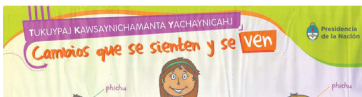
Fig. 3: Primera versión de lámina ESI en quechua (detalle)

No fue una discusión sencilla. La palabra “sexual” –reducida durante mucho tiempo a aspectos biológicos o vinculada exclusivamente a relaciones sexuales genitales, a lo reproductivo– generaba cierta incomodidad. Y, más allá de que para algunxs integrantes del pueblo quechua, este título “de alguna manera achica el pensamiento originario porque está muy castellanizado”, y “el título anterior era más representativo y más amplio como lo es la dimensión de ESI”, la decisión final fue aceptada a partir del trabajo colectivo de idóneos e idóneas. 10