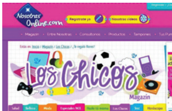
Fig. 2: “Nosotras”, sección “Los chicos”

El sitio web también cuenta con una sección llamada “Los Chicos”. Esta sección está dirigida, nuevamente, a niñas y/o adolescentes que quieran saber más sobre las personas del género masculino. Así, “Nosotras”, asume una lectura heteronormada de la sociedad en la que estos dos géneros se muestran como opuestos. Además, a partir de distintas ilustraciones, podemos observar cómo la empresa expone los estereotipos que históricamente caracterizaron a varones cis . Estos se muestran con objetos relacionados a la tecnología y al deporte, como los videojuegos, la pelota de fútbol, etc.