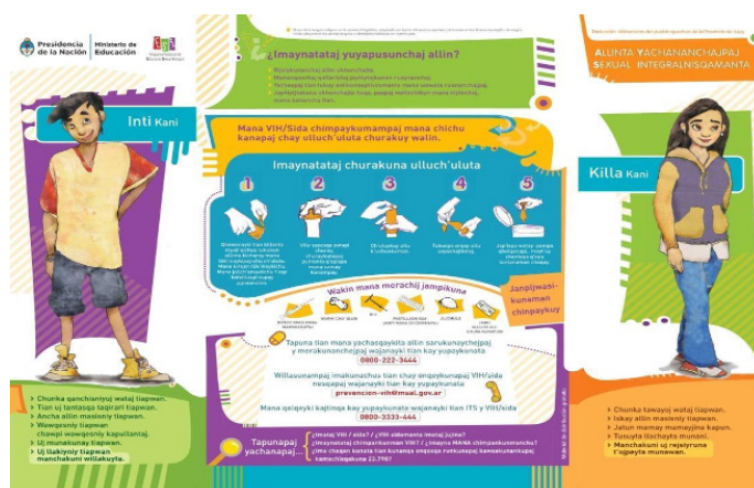
Fig. 2: Lámina ESI de nivel secundario: Biografías individuales: Soy Rubén, soy María