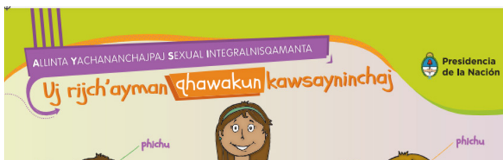
Fig. 4: Lámina ESI en quechua (detalle)

El caso del guaraní fue diferente. El debate fue por una palabra: ñemeno o poreno era, para las mujeres,