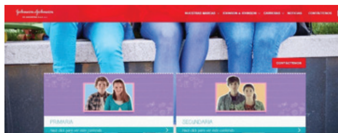
Fig. 3: página web de “Johnson & Johnson”

En el caso del sitio web de la empresa “Johnson & Johnson”, la situación no resulta ser diferente. El binarismo, también, señala solo dos géneros y los divide en pares opuestos e irreconciliables, desoyendo las transformaciones culturales respecto de los géneros y la sexualidad. De esta manera, la identidad de género debería encerrar a cualquier persona dentro de ciertas normas masculinas o femeninas. En consecuencia, la heterosexualidad es considerada como la única orientación sexual normal y aceptada. ¿Qué ocurre, entonces, con las personas que no se autoperceben ni varón ni mujer cis y con las que no se sienten atraídas por el género “opuesto”?