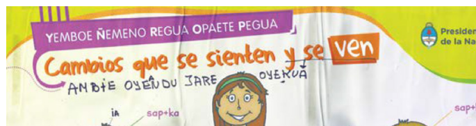
Fig. 5: Lámina ESI en ava guaraní (detalle)

Según esta interpretación, la ESI acompañaba una necesidad comunitaria de prevención, aprendizaje y cuidado del cuerpo y la salud. La palabra elegida permitía, en primer término, acompañar a lxs jóvenes en el uso de métodos anticonceptivos para evitar infecciones de transmisión sexual (ITS) y embarazos no intencionales. Finalmente, varias mburuvichas e idóneas acordaron la forma de nombrar la ESI: Yemboe Ñemeno Regua Opaete Pegua . Enseñar todo lo referente a la relación/acto sexual (tal es la traducción) fue un título que sintetizaba las preocupaciones y demandas de la comunidad (fig. hh5).